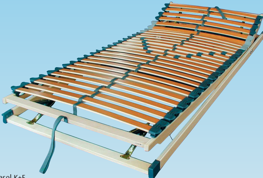
Abbildung: Basel K+F